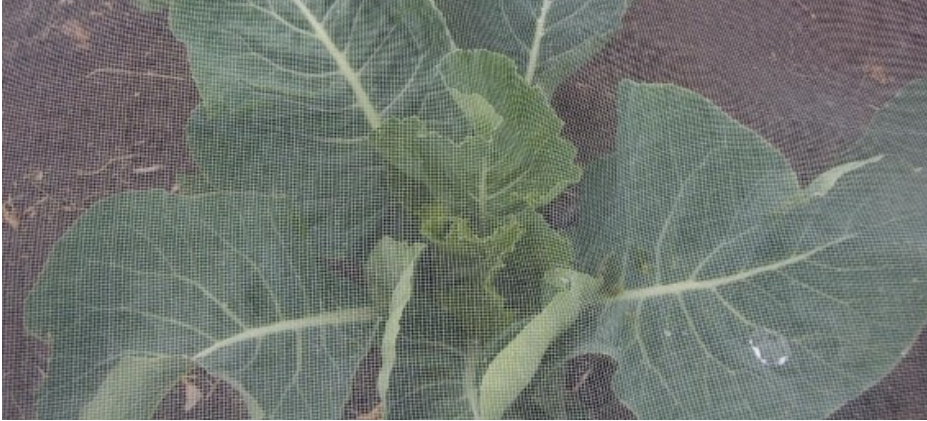
Billede 1. Insektnet.